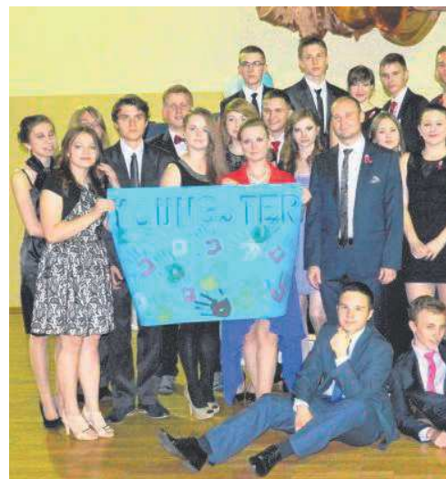
► Uczniowie Zespołu Szkół w Ujeździe „przerabiają”

Nasz region reprezentują: ● Zespół Szkół w Ujeździe ● Gimnazjum w Kurowicach